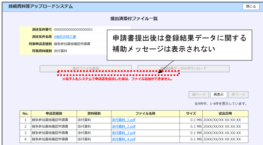
図 3-2 提出済添付ファイル一覧画面_申請書提出後